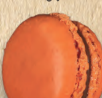
Caramel beurre salé