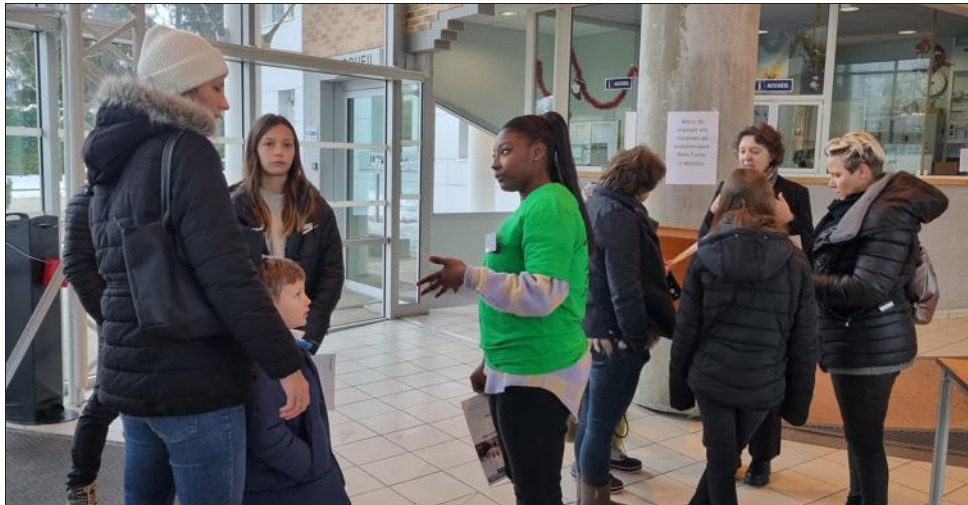
Des lycéens "sentinelles", en vert, présentent l'établissement et orientent les familles.

Avec des conseils de classe début novembre, le lycée peut déjà agir auprès des élèves en difficul-