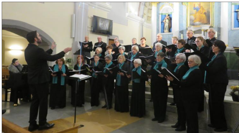
La touche finale du troisième marché de Noël a été apportée par un concert de musique française très applaudi par le public.